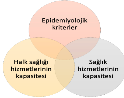
Şekil 1. Risk değerlendirmesinde kullanılan kriterler

COVID-19 pandemisi sırasında birçok ülkede birçok kez kapanma ve sonrasında önlemler gevşetilerek açılma dönemleri uygulanmıştır. Açılma dönemi çeşitli ölçütler dikkate alınarak izlenmesi gereken bir süreçtir. Açılma sürecinin ilerleyişine yön veren, Şekil 1’de gösterildiği gibi, 3 grup kriter mevcuttur.